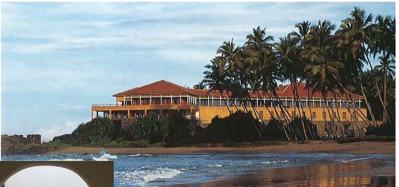
ライトハウス ホテル (外観 ゴール)