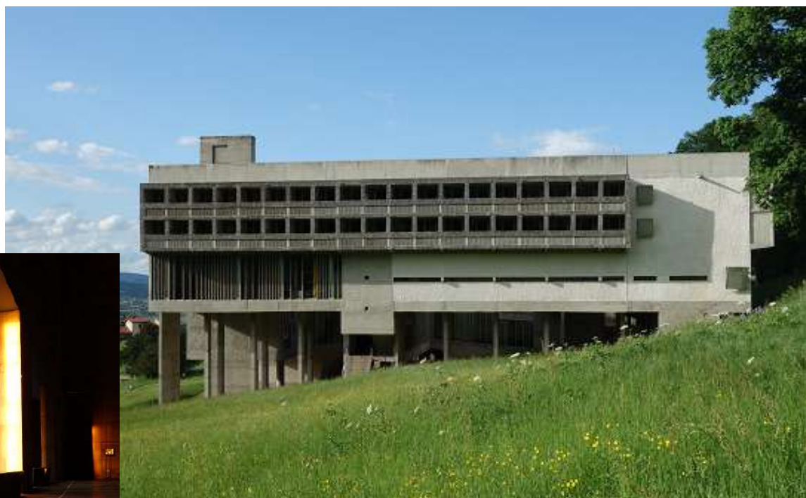
ラ・トゥーレット修道院